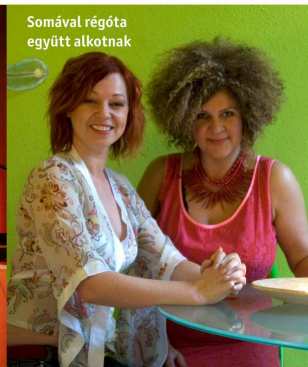
Somával régóta együtt alkotnak

az első lépés az kell, hogy legyen, hogy megfogalmazzuk a vágyainkat. Ha én azt szeretném, hogy egész nap főzök, mert úgy érzem, ebben teljesedhetek ki, akkor minél több lehetőséget kell teremtenem arra, hogy fakanelat ragadhassak. Ha pedig boldogtalan vagyok a párkapcsolatomban, akkor ki kell tudnom mondani, hogy mit szeretnék módosítani.